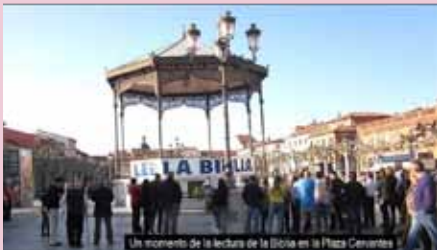
Cientos de personas y representantes de PP y PSOE acuden a la Plaza Cervantes de Alcalá para leer la Biblia.

La Biblia utilizada fue una traducción protestante de los textos originales (La Palabra)